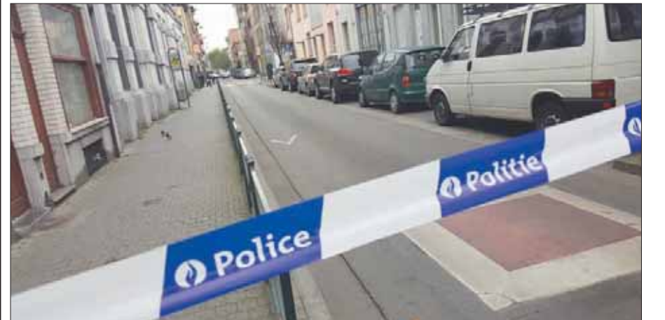
إجراءات أمنية في حي مولنبيك بعد هجمات العاصمة الفرنسية باريس