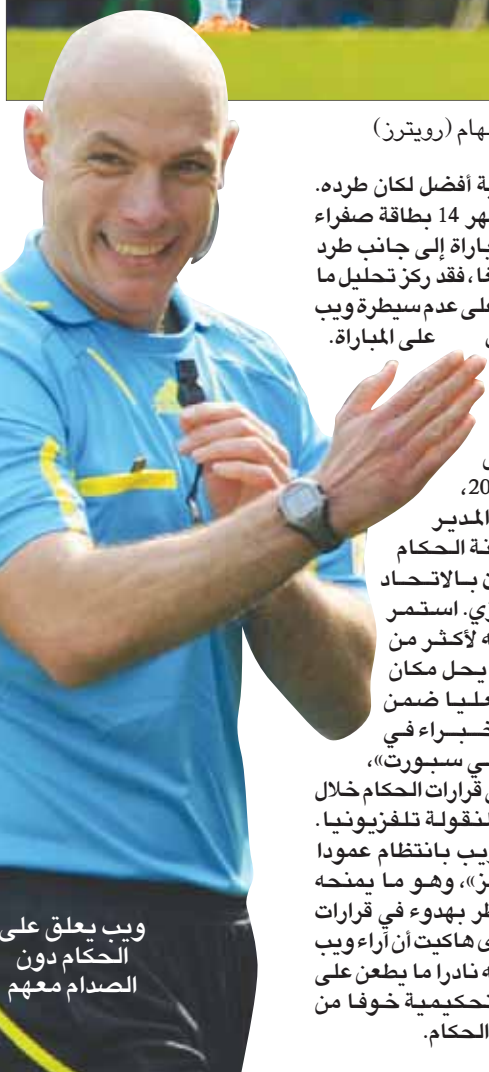
ويب يعلق على الصدام مع الحكم دون غضب

له زاوية رؤية أفضل لكان طرده. ورغم أنه أشهر 14 بطاقة صفراء على مدار المباراة إلى جانب طرد جون هيتيناغا، فقد ركز تحليل ما حصل بعد المباراة على عدم سيطرة ويب بشكل كامل على المباراة. عندما اعتزل ويب التحكيم في أغسطس 2014، تولى دور المدير الفني للجنة الحكام المحترفين بالاتحاد الإنجليزي. استمر في منصبه لأكثر من عام قبل أن يحل مكان هالسي فيلدا ضمن فريق الخبراء في قنات «بي تي سبورت»، للفرع على قرارات الحكام خلال المباريات المنقولة تلفزيونياً. كما يكتب ويب بانتظام عموداً في «التايمز»، وهو ما يمنحه الفرصة للنظر بعمق في قرارات الحكام. ويرى هاكيت أن آراء ويب محافظة وأنه نادراً ما يطعن على القرارات التحكيمية خوفاً من إزعاج لجنة الحكم.