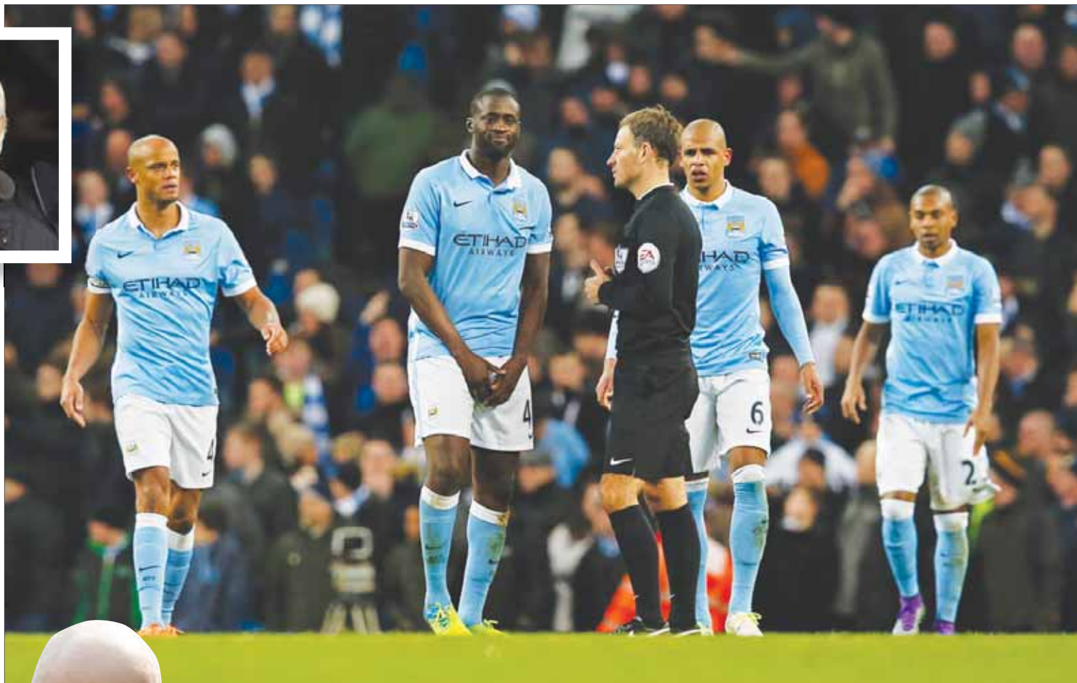
الحكم كلانتنبرغ محاط بلاعبين سيتي المعترضين على ركلة جزاء احتسبها لتوتنهام

من غير المرجح أن يصل حكم آخرون لمستوى نفسه، خصوصاً في الكرة الإنجليزية، بسبب غياب التواصل.