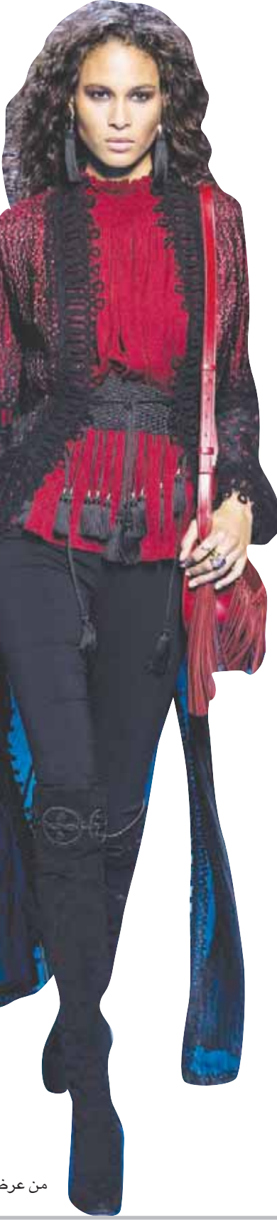
من عرضه الأخير

مثل كوتشيللا، وهو ما بدا واضحا في تلك التي نسقها مع أحذية عالية الرقبة «بوتات»، فهي التطريزات لم تغب تماما، فهي ماركته المسجلة، إذ جاءت بحبات لؤلؤ ضخمة وأحجار كريستال كما بالترتر والخرز، بحيث تبدو التطريزات وكأنها وشم، لكنه خفف منها بشكل ملحوظ مقارنة بالمواسم الماضية.