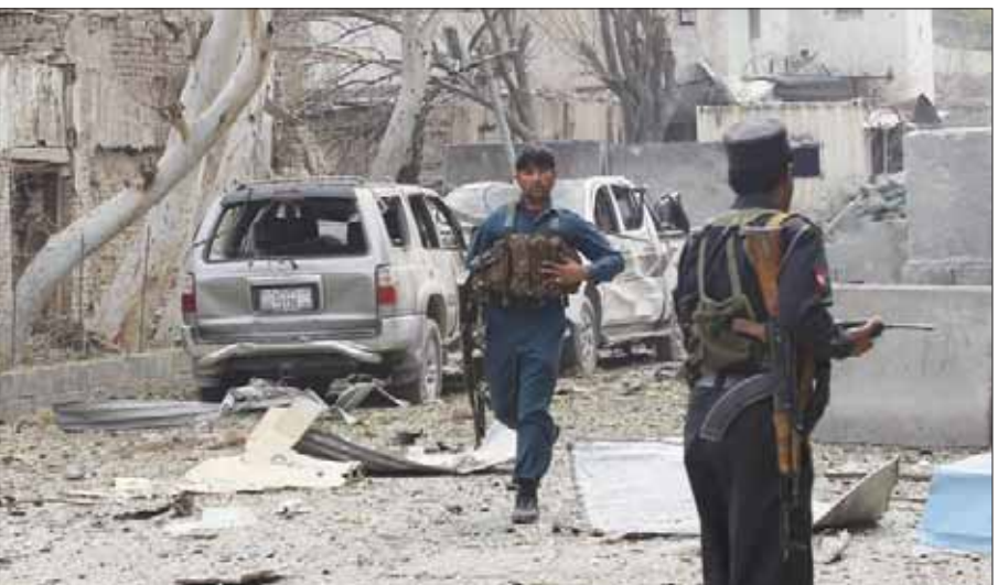
جنديان من الشرطة الأفغانية أمام القنصلية الهندية في جلال آباد بعد تعرضها لاعتداء الأسبوع الماضي

التي تنتشر على عدة جبهات في أفغانستان إلى التخفيف من حجم انتشارها في البلاد. وكان الجنرال ويلسون شوفر المتحدث باسم الجيش الأميركي صرح للصحافيين في يناير (كانون الثاني) أن القوات الأفغانية تقيم كثيراً من الحواجز وأن كثيراً من جنودها منتشرون على الحواجز. وأضاف: «هناك مقولة عسكرية قديمة تقول إنك إذا دافعت عن كل مكان فإنك لا تدافع عن أي مكان». وقال شوفر إن الجيش الأفغاني يواجه نقصاً كبيراً في العديد من احتياجاته إلى 25 ألف جندي إضافي ما يجعل من الضروري أن يخفص انتشاره على بعض الحواجز. ومن المتوقع أن تتخلى القوات الحكومية التي قتلت دون الدعم الكامل لحلف شمال الأطلسي منذ انتهاء مهمته القتالية في ديسمبر (كانون الأول) عن مزيد من الحواجز مع تصاعد المعارك وسط تعثر جهود السلام. وسجل العام الماضي أكبر عدد من الإصابات بين المدنيين طواقم للأمم المتحدة، بلغ 11 ألف مدني في 2015، بينهم 3545 قتيلًا، وهو أعلى عدد منذ بدأت الوكالة جمع الإحصاءات في 2009. ورفضت حركة طالبان أول من أمس إجراء محادثات مباشرة مع الحكومة الأفغانية، ما بوجه ضربة للجهود الدولية لإنعاش المفاوضات التي تهدف إلى إنهاء 14 عاماً من التمرد. إلا أن الاستراتيجية الجديدة لا تأخذ في الاعتبار عنصرًا مهمًا وهو محنة الاعتبارات