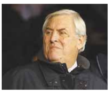
الحكم السابق هاكيت يدعم التواصل مع الجمهور

وهناك حكم واحد يبدو أنه في منأى عن الإساءات والذم المعتادين، وهو الإيطالي بيير لويجي كولينا الذي حقق سبقاً لافتاً باختياره أفضل حكم في العالم لست سنوات متتالية بين 1998 و 2003. ونادراً ما تعرض كولينا ولو لمجرد التلميح بالنقد في مهنة تعد السخرية التي لا تتوقف جزءاً لا يتجزأ من سماتها.