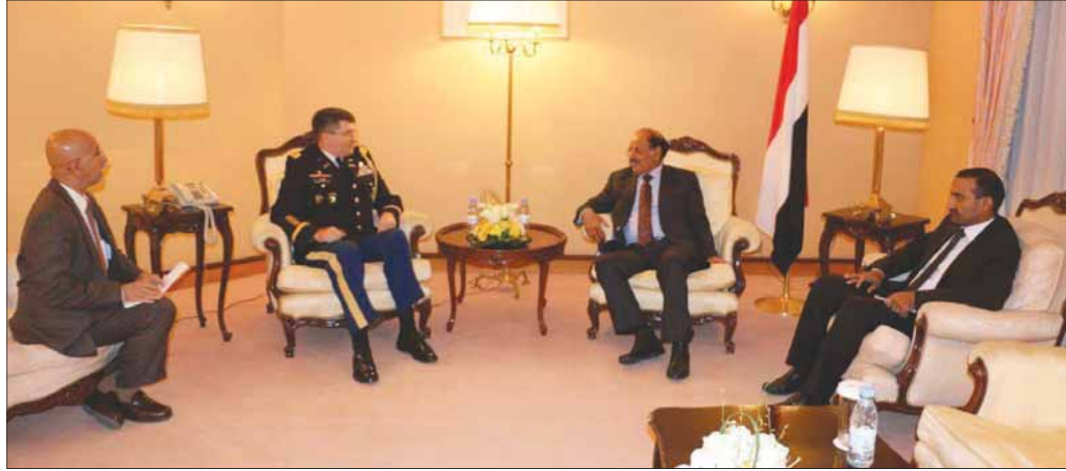
الفريق الركن علي محسن الأحمر لدى استقباله للمحق العسكري الأميركي باليمن ديفيد كوبز ونائبه الأسبوع الماضي في مقر إقامته المؤقتة بالرياض

يكثف نائب القائد الأعلى للقوات المسلحة الفريق الركن علي محسن الأحمر، لقاءاته بمشايخ القبائل في محافظة صنعاء (ريف العاصمة)، وتحديدًا أبناء القبائل والمناطق المحيطة بالعاصمة من مختلف الاتجاهات، في الوقت الذي كشفت فيه مصادر قريبة لـ«الشرق الأوسط» عن قيام المخلوع علي عبد الله صالح بتوزيع أموال وسيارات وأسلحة وذخائر لعدد من المشايخ في مناطق الطوق للعاصمة صنعاء خلال الأيام القليلة الماضية.