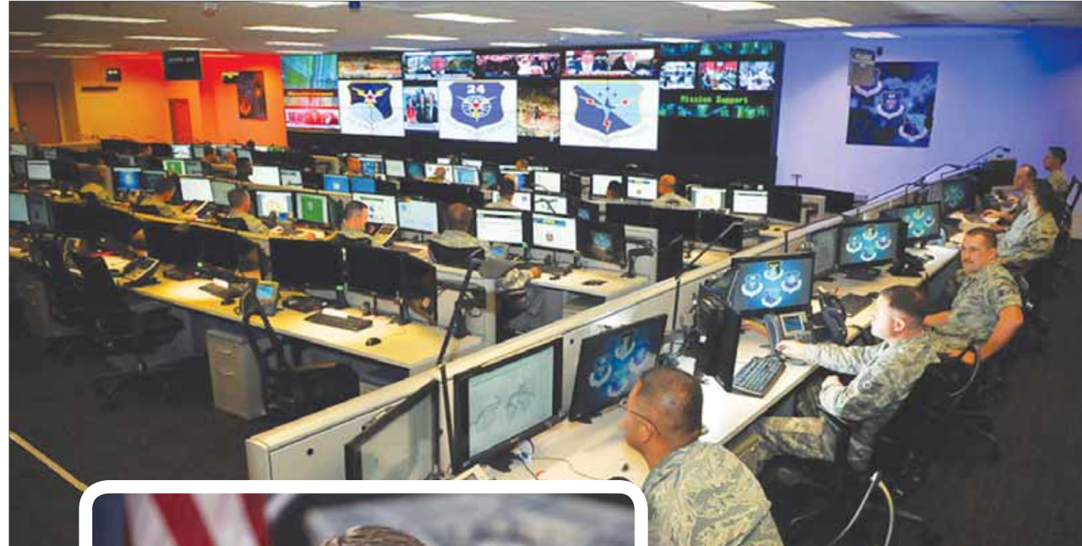
البنتاغون أعلن عن حرب إلكترونية لتفكيك شبكات اتصالات «داعش» (الشرق الأوسط)

حسب وكالة «رويترز»، الحرس الوطني قوة عسكرية احتياطية، لكن يمكن تعبئته للضروريات الوطنية. ويمثل جزءاً أساسياً من الجهد الأوسع للقوات المسلحة لتأسيس أكثر من 120 فرقة إلكترونية للرد على الهجمات الإلكترونية ومنعها. تتألف واحدة من هذه الفرق من عاملين في شركات كومبيوتر وإنترنت، مثل شركتي «فايس بوك» و«غوغل»، أو وظيفته، إن الهجمات ستبدأ في أيريل (نياسان) المقلد. ولم يذكر المسؤول عدد الطائرات، ولا عدد أفراد طواقمها. لكنه قال إن «بي 52» ستحل محل طائرات «بي 1» التي تشارك في الحرب ضد مواقع «داعش» في سوريا والعراق. يستخدم السلاح الجوي الأميركي قاذفات «بي 52» في