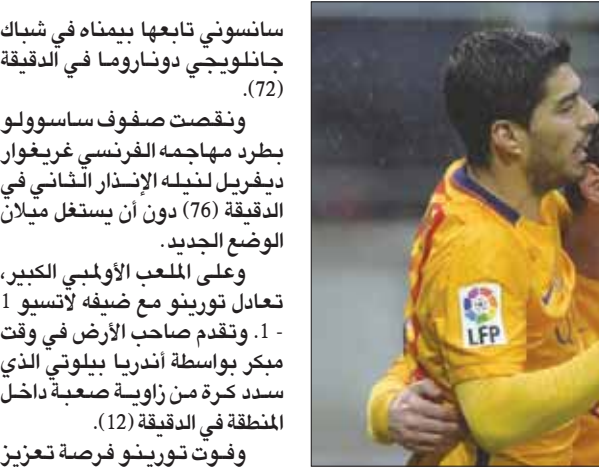
ميسي في المنتصف يتلقى التهاني بهدفه من الحادي وسواريز

الملك العاشر إلى 40 نقطة بعد هذا التعادل وأصبح هيدينيك أول مدرب في الدوري الإنجليزي الممتاز يحرز 12 مباراة دون هزيمة في بداية توليه المهمة. وقال هيدينيك: «يذكر الجميع كيف كان الموقف عندما توليت المهمة في ديسمبر (كانون الأول)، وكنا على بعد نقطة واحدة من منطقة الهبوط، كان الفريق يشعر ببعض التوتر لأن تشيلسي لا يمكن أن يكون في مثل هذا المركز. كان هدفنا الابتعاد عن منطقة الهبوط بأسرع شكل ممكن، وهو ما تحقق بالفعل». وواجه تشيلسي صعوبات