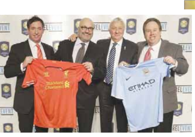
ستيليتانو مع نجم ليفربول السابق فوول ونجم مانشستر سيتي وإنجلترا السابق سمرسي