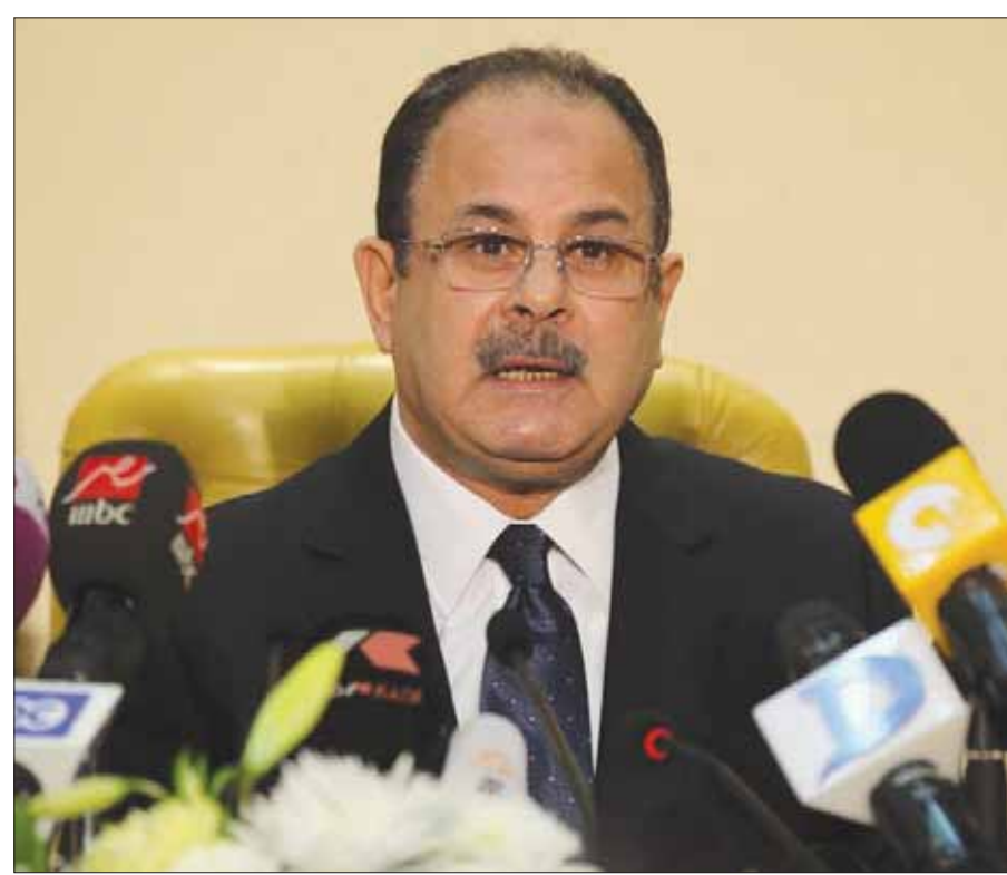
اللواء مجدي عبد الغفار، وزير الداخلية المصري، في المؤتمر الصحفي الذي عقده في القاهرة أمس (أ.ف.ب)

وأضاف الوزير أنه «بهذا تكون جماعة الإخوان الإرهابية هي المسؤولة عن هذا الحادث، باعتبار الكوادر التي شاركت واستمرت نحو شهر وكانوا فيها على تواصل مع عناصر حركة حماس، ومع القيادي الإخواني موسى، لافتاً إلى أنهم أعدوا نفياً وجود أي من عناصرها في العملية وتزن 80 كيلوغراماً في محافظة الشرقية (شرق القاهرة).