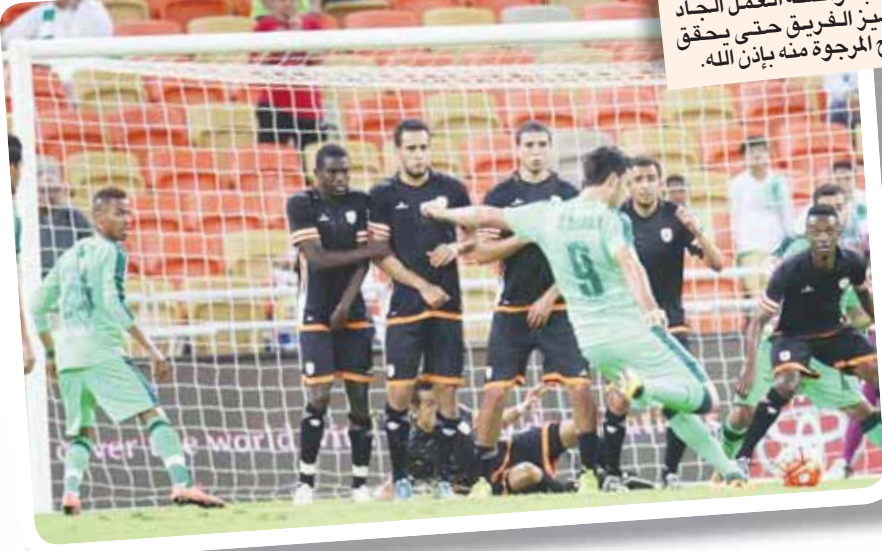
السومة أثناء التسديدة التي جاء منها الهدف الأول

ومر الوقت المحتسب بدلا من الضائع دون أي جديد يطلّق الحكم صافرة نهاية هذا الشوط