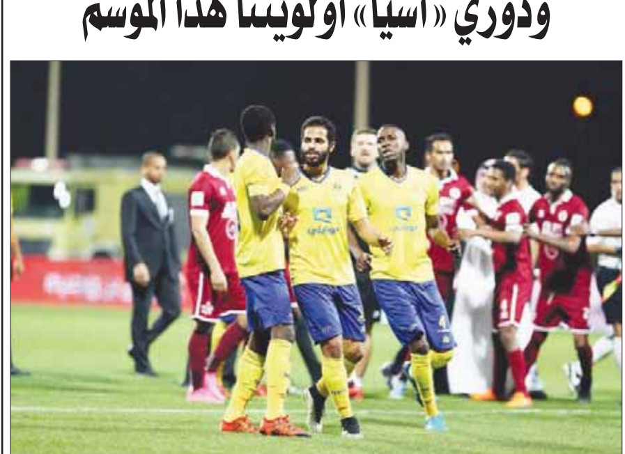
لاعبو النصر بعد مباراتهم أمام الفيصلي