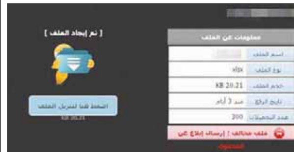
صورة من ملفات «داعش»

من عناوين سكن هؤلاء الضباط تظهر على الموقع، بما في ذلك أرقام الهواتف المحمولة لهؤلاء الضباط. وجرى تحميل الملف على موقع تبادل معلومات باللغة العربية الأربعة الماضي، ويحاول صباح السبت جرى تحميل البيانات 300 مرة.