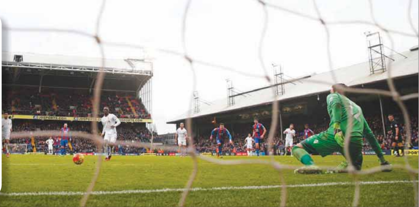
بنيتيكي يسجل من ركلة الجزاء لينجح ليفربول الفوز على كريستال بالاس