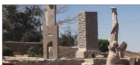
جانب من الأعمال الفنية في المعرض

وصرح النمنم: «سنعمل على أن يكون المتحف المفتوح للسبوزيوم جزءاً من الخريطة الثقافية وأيضاً السياحة لأسوان ومصر كلها؛ لأنه يؤكد على أن الإنسان الذي استطاع ترويض النيل بإنشاء خزان أسوان والسد العالي قادر على أن يروض الجرائنيت».