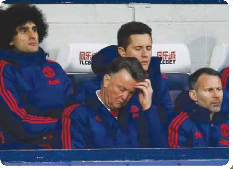
الإحباط على ملامح فان غال مدرب يونائيد بعد السقوط أمام بروميتش