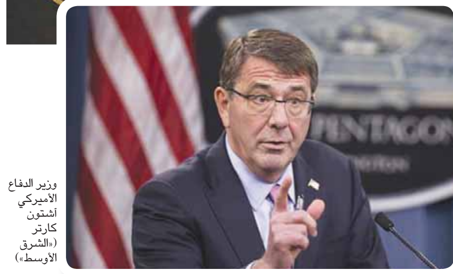
وزير الدفاع الأميركي أشتون كارتر

كابول - «الشرق الأوسط» قتل تركيَّان، وجرح 3 آخرون، جراء تعرض محل تجاري يديرانه، لهجوم مسلح في العاصمة الأفغانية كابول، الليلة الماضية. وبحسب معلومات، فإن الهجوم وقع أثناء اجتماع عمل، وأسفر عن مقتل تركيين، وجرح اثنين آخرين، فضلاً عن إصابة أفغاني ثالث. وذكر شهود عيان، أن الهجوم نفذته مسلحون، في ساعة متأخرة من ليلة أمس، وأنهم فتحوا النار على المارة أيضاً. ولم تصدر أي تصريحات عن المسؤولين الأفغان حيال الهجوم، كما لم تعلن أي جهة تبنيها له. وسرت معلومات غير مؤكدة بخطف مواطن تركي في منطقة «قلعة فتح الله» بالعاصمة كابول، بعد ساعة من الهجوم على المحل التجاري.