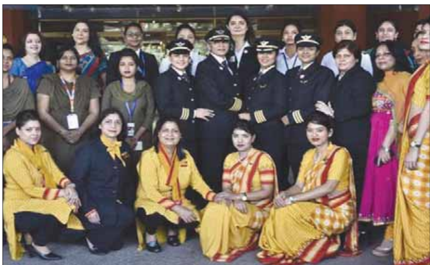
طاقم رحلة طيران «إير انديا»