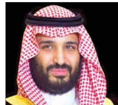
الرياض، «الشرق الأوسط»

استعرض الأمير محمد بن سلمان بن عبد العزيز ولي ولي العهد النائب الثاني لرئيس مجلس الوزراء وزير الدفاع الأفغاني محمد معصوم ستانكزاي، أوجه التعاون بين البلدين في مجال مكافحة التطرف والإرهاب. كما بحث ولي ولي العهد، خلال اتصال هاتفي تلقاه يوم أمس من الوزير الأفغاني، العلاقات الثنائية وسبل تطويرها.