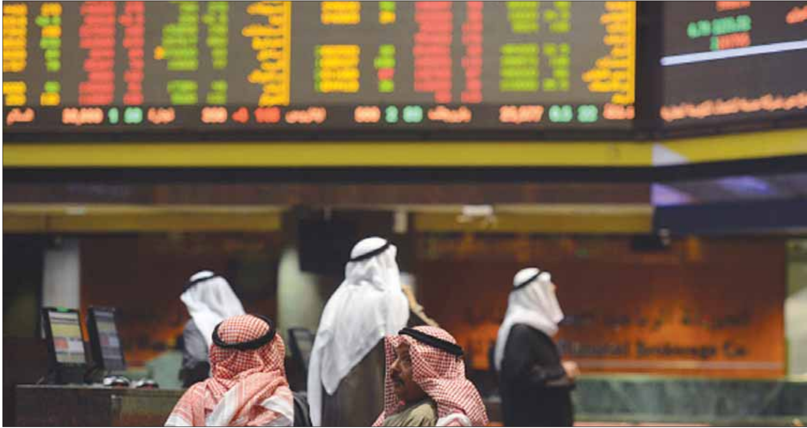
جانب من تداولات سوق الأسهم السعودية

أظهرت بيانات اقتصادية جديدة، أن المستثمرين الأجانب يمتلكون ما نسبته 4,3 في المائة من القيمة السوقية للأسهم السعودية، فيما كشفت هذه البيانات أن ملكية المستثمرين الأجانب شهدت تحسناً ملحوظاً خلال الأسبوع المنصرم، مما يعني أن سوق الأسهم السعودية باتت منصة استثمارية جاذبة لرؤوس الأموال الأجنبية. وفي هذا الإطار، قادت الارتفاعات الإيجابية التي شهدتها أسعار النفط، مع ختام تعاملات الأسبوع المنصرم، مؤشر سوق الأسهم السعودية خلال تعاملاته يوم أمس الأحد، إلى تحقيق ارتفاعات جديدة، قفز من خلالها مؤشر السوق العام فوق مستويات 6300 نقطة مجدداً، وسط تدفق ملحوظ للسائلة النقدية الاستثمارية. وتلعب أسعار النفط، دوراً محورياً في توجيه بوصلة مؤشر سوق الأسهم السعودية خلال الفترة الحالية، في وقت تعتبر فيه السوق المالية السعودية من أكثر أسواق المنطقة جاذبية للسائلة النقدية، بعد قرارات مهمة اتخذتها البلاد مؤخراً، بهدف تحفيز الاقتصاد، وزيادة أهمية السوق المالية أمام المستثمرين الأجانب، كأحدى الوجهات الاستثمارية الجاذبة. وفي هذا الشأن، أنهى مؤشر سوق الأسهم السعودية تعاملات يوم أمس الأحد على ارتفاع بنسبة 2,9 في المائة، ليغلق بذلك عند مستويات 6396 نقطة، أي بارتفاع بلغ حجمه نحو 180 نقطة، مسجلاً بذلك أعلى إغلاق في شهرين، وسط تداولات نشطة بلغت قيمتها 6,8 مليار ريال (1,8 مليار دولار)، وهي السائلة النقدية الأعلى خلال تعاملات شهرين متتاليين. وجاء ارتفاع سوق الأسهم