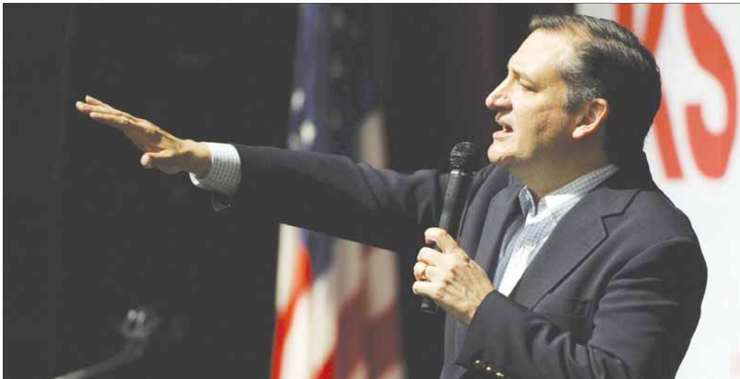
المرشح في السباق الجمهوري للانتخابات الرئاسية تيد كروز يتحدث في مؤتمر كنساس أول من أمس

أما في المعسكر الديمقراطي، فقد أنعش فوز برني ساندرز، في ولايتي كنتساس ونبراسكا، حملة المرشح الذي بهاجم باستمرار أوساط المال، بعدما أضعف إلى حد كبير بعد «الثلاثاء الكبير» مع فوز كلينتون في سبع ولايات. لكن السيدة الأولى السابقة لا تزال الأوفر حظا للفوز في انتخابات الحزب الديمقراطي كمرشحة إلى الاقتراع الرئاسي في نوفمبر المقبل، حيث ثبتت بقوة تقدمها بفوز كبير حققته في لوزيانا، أهم ولاية شهدت انتخابات مساء السبت. وحصلت كلينتون حتى الآن على 59 مندوبا في لوزيانا، 37 في كنتساس و25 في نبراسكا. وقد استقادت كلينتون خصوصا من دعم السود الذين لم ينح ساندرز في سبب أصواتهم.