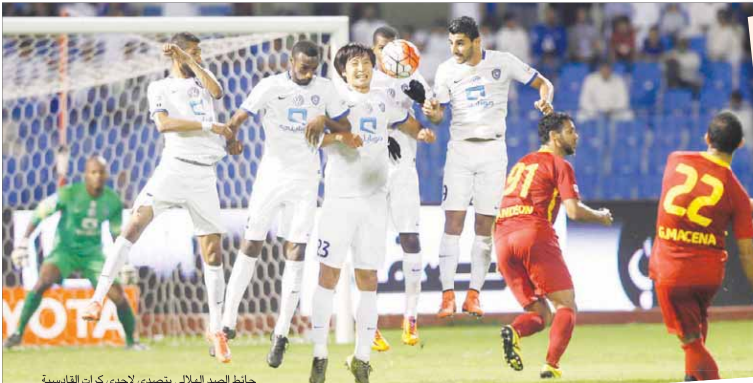
حائط الصد الهلالي يتصدى لإحدى كرات القادسية